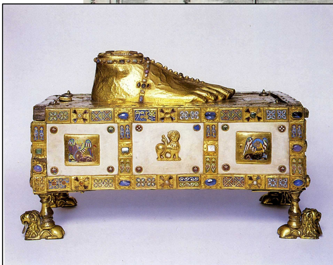
Andreas-Tragaltar im Trierer Domschatz